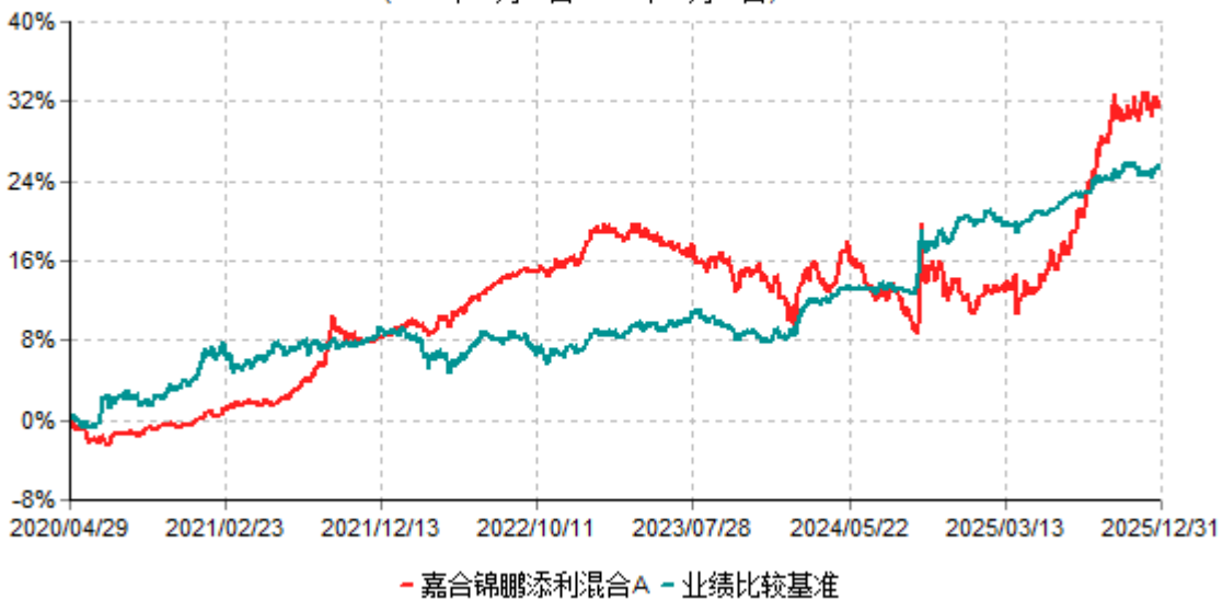
嘉合锦鹏添利混合A累计净值增长率与业绩比较基准收益率历史走势对比图 (2020年04月29日-2025年12月31日)