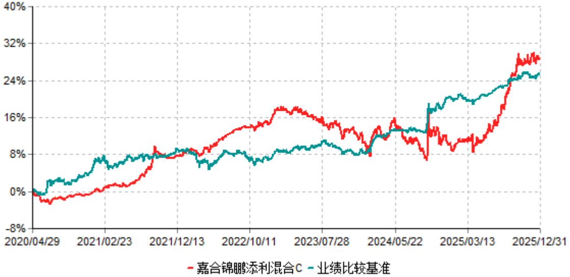
嘉合锦鹏添利混合C累计净值增长率与业绩比较基准收益率历史走势对比图 (2020年04月29日-2025年12月31日)