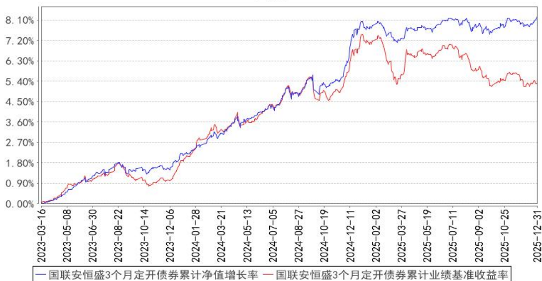
国联安恒盛3个月定开债券累计净值增长率与同期业绩比较基准收益率的历史走势对比图

注：1、本基金业绩比较基准为中债综合指数收益率； 2、本基金基金合同于 2023 年 3 月 16 日生效； 3、本基金建仓期为自基金合同生效之日起的 6 个月，建仓期结束时各项资产配置符合合同约定。