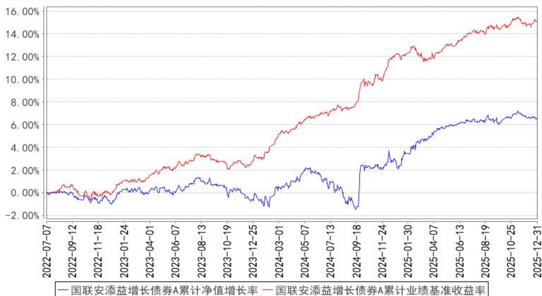
国联安添益增长债券A累计净值增长率与同期业绩比较基准收益率的历史走势对比图

注：1、本基金业绩比较基准为中债新综合财富指数收益率*90%+沪深 300 指数收益率*8%+中证港股通综合指数(人民币)收益率*2%；