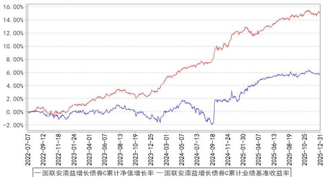
国联安添益增长债券C累计净值增长率与同期业绩比较基准收益率的历史走势对比图

注：1、本基金业绩比较基准为中债新综合财富指数收益率*90%+沪深 300 指数收益率*8%+中证港股通综合指数(人民币)收益率*2%；