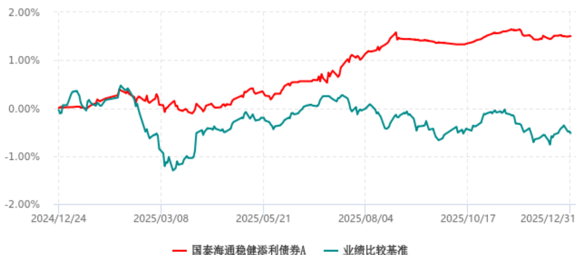
国泰海通稳健添利债券A累计净值增长率与业绩比较基准收益率历史走势对比图 (2024年12月24日-2025年12月31日)

注：按基金合同和招募说明书的约定，本基金的建仓期为六个月，建仓期结束时各项资产配置比例符合基金合同的有关约定。