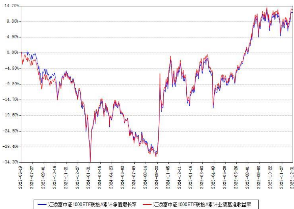
汇添富中证1000ETF联接A累计净值增长率与同期业绩比较基准收益率对比图