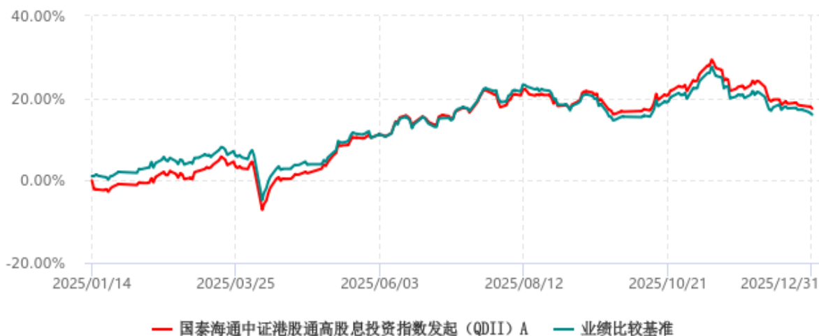
国泰海通中证港股通高股息投资指数发起（QDII）A 累计净值增长率与业绩比较基准收益率历史走势对比图 (2025年01月14日-2025年12月31日)

注：1、本基金于 2025 年 01 月 14 日成立，自合同生效日起至本报告期末不足一年。 2、按基金合同和招募说明书的约定，本基金的建仓期为六个月，建仓期结束时各项资产配置比例符合基金合同的有关约定。