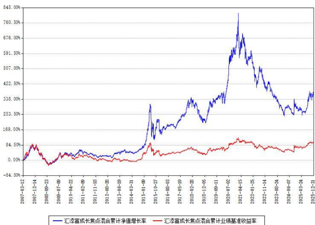
汇添富成长焦点混合累计净值增长率与同期业绩基准收益率对比图

注：本基金建仓期为本《基金合同》生效之日（2007年03月12日）起6个月，建仓期结束时各项资产配置比例符合合同约定。