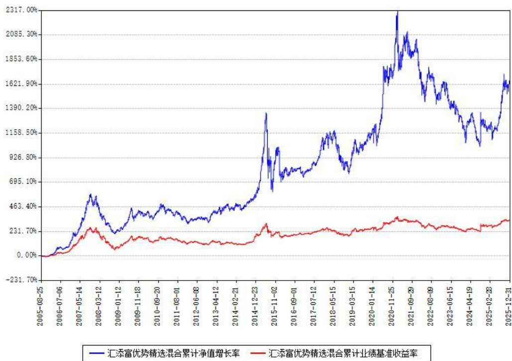
汇添富优势精选混合累计净值增长率与同期业绩比较基准收益率对比图

注：本基金建仓期为本《基金合同》生效之日（2005年08月25日）起6个月，建仓期结束时各项资产配置比例符合合同约定。