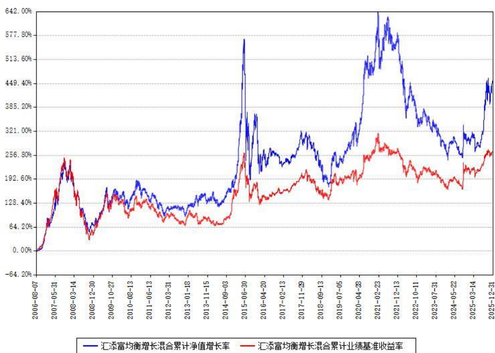
汇添富均衡增长混合累计净值增长率与同期业绩比较基准收益率对比图

注：本基金建仓期为本《基金合同》生效之日（2006年08月07日）起6个月，建仓期结束时各项资产配置比例符合合同约定。