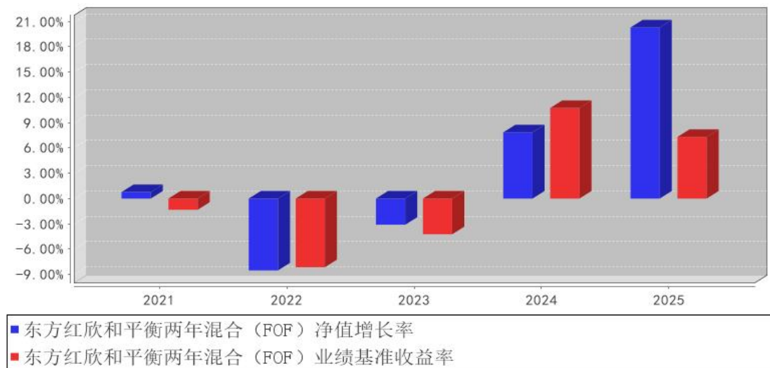
东方红欣和平衡两年混合（FOF）基金每年净值增长率与同期业绩比较基准收益率的对比图

注：本基金合同生效日期为 2021 年 03 月 09 日，合同生效当年期间的相关数据和指标按实际存续期计算，不按整个自然年度进行折算。