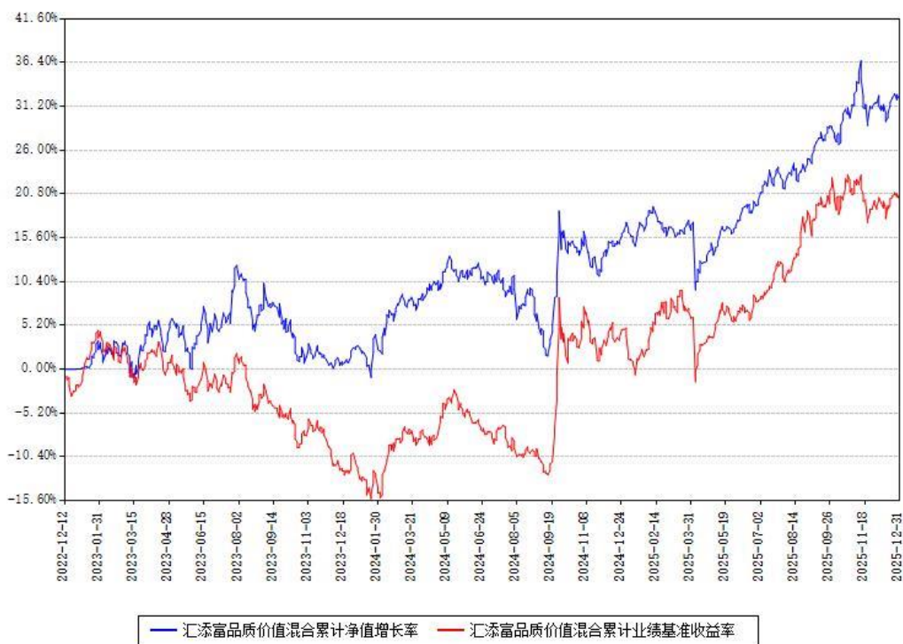
汇添富品质价值混合累计净值增长率与同期业绩比较基准收益率对比图

注：本基金建仓期为本《基金合同》生效之日（2022年12月12日）起6个月，建仓期结束时各项资产配置比例符合合同约定。