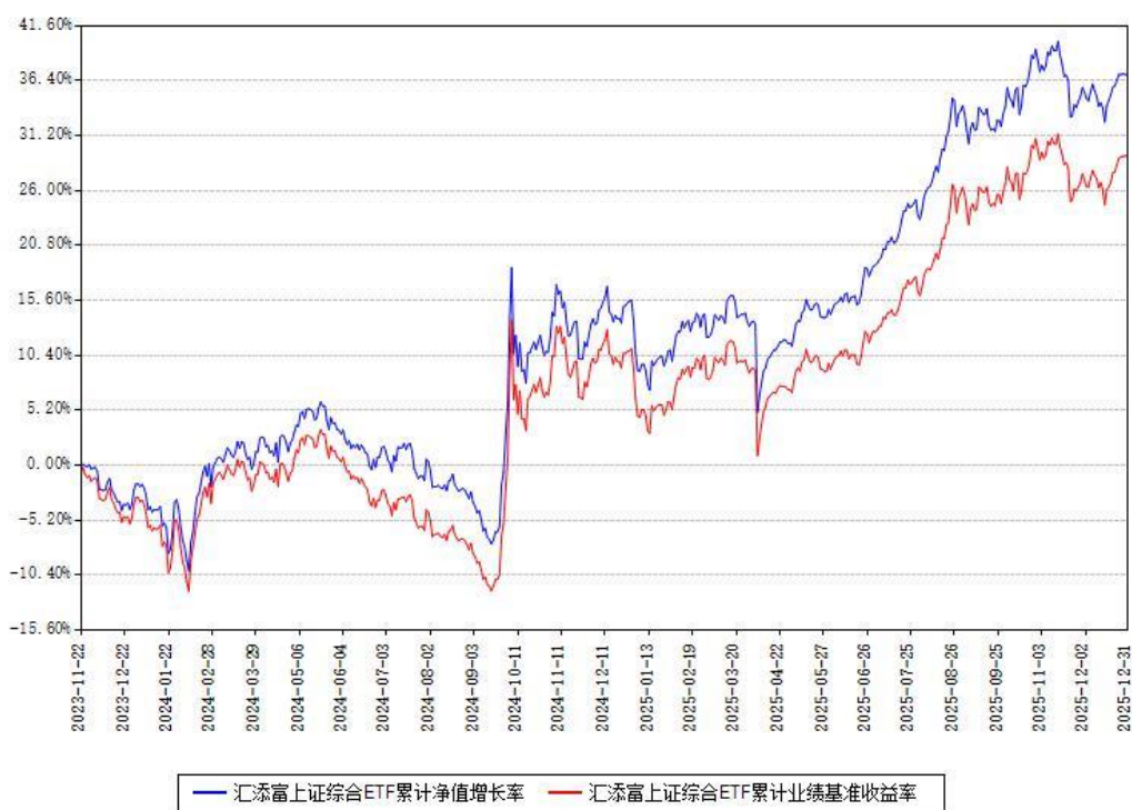
汇添富上证综合ETF累计净值增长率与同期业绩基准收益率对比图

注：本基金建仓期为本《基金合同》生效之日（2023年11月22日）起6个月，建仓期结束时各项资产配置比例符合合同约定。