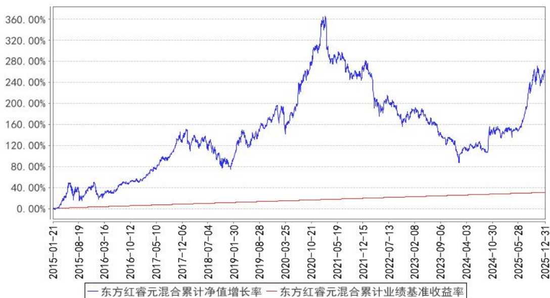
东方红睿元混合累计净值增长率与同期业绩比较基准收益率的历史走势对比图