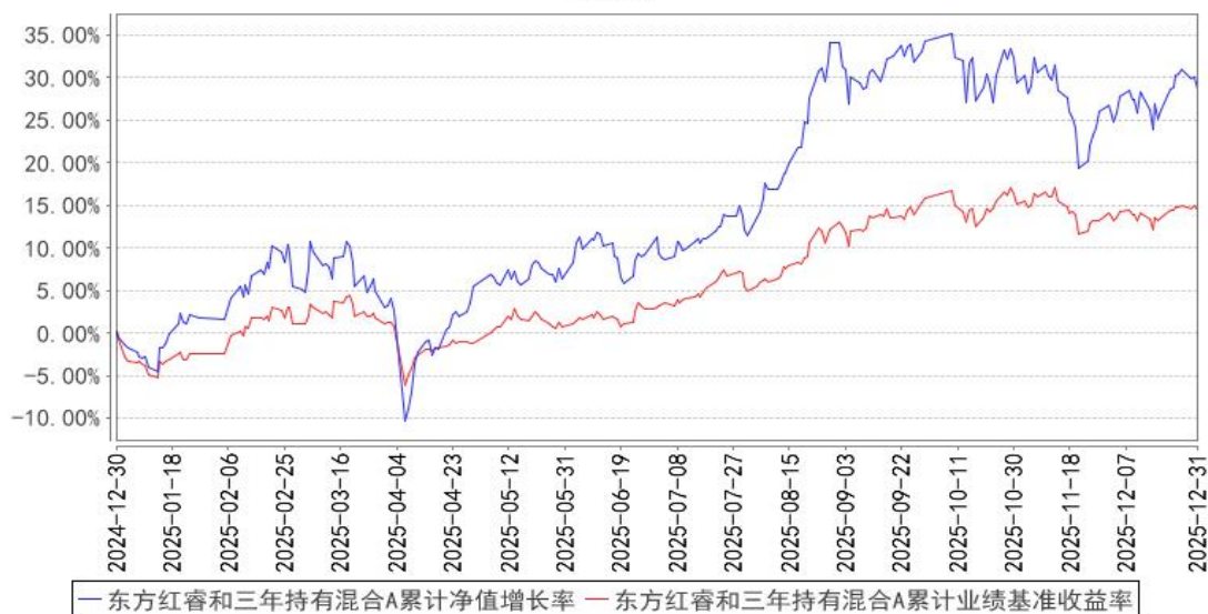
东方红睿和三年持有混合A累计净值增长率与同期业绩比较基准收益率的历史走势对比图