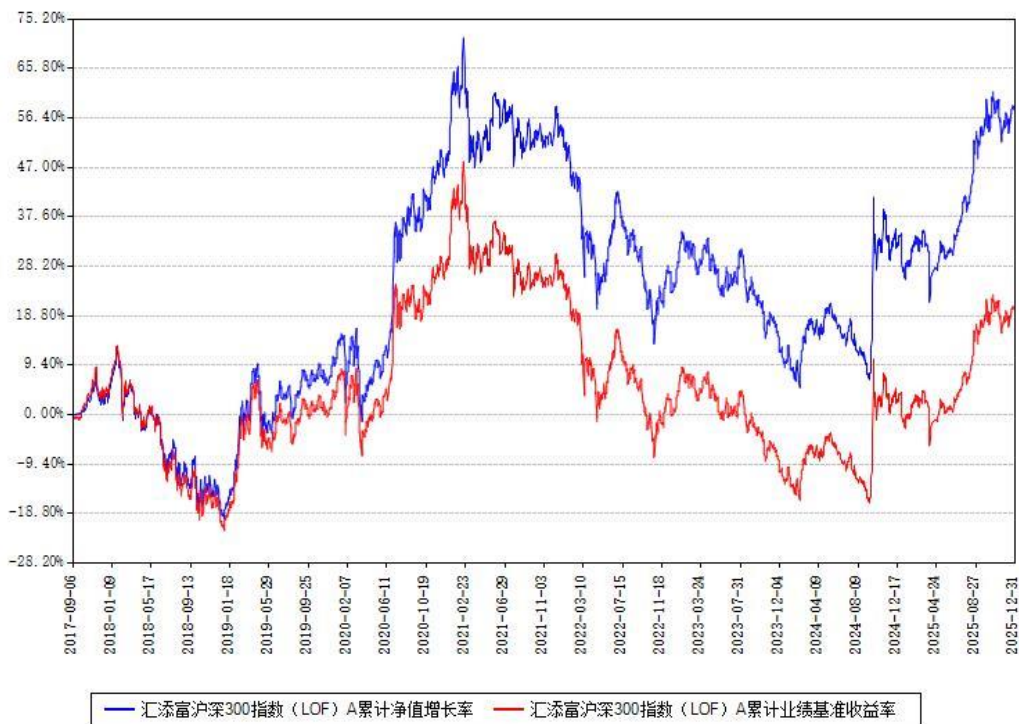
汇添富沪深300指数 (LOF) A 累计净值增长率与同期业绩基准收益率对比图