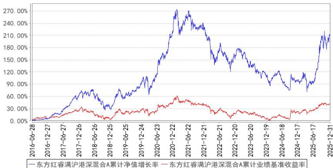
东方红睿满沪港深混合A累计净值增长率与同期业绩比较基准收益率的历史走势对比图