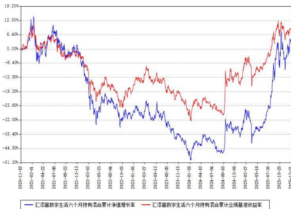
汇添富数字生活六个月持有混合累计净值增长率与同期业绩比较基准收益率对比图

注：本基金建仓期为本《基金合同》生效之日（2020年11月18日）起6个月，建仓期结束时各项资产配置比例符合合同约定。