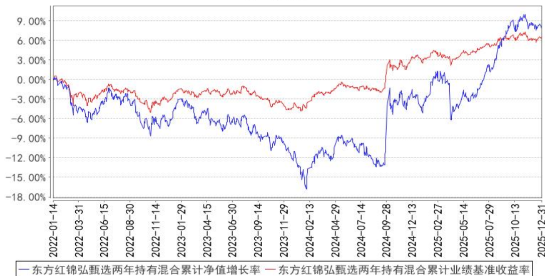
东方红锦弘甄选两年持有混合累计净值增长率与同期业绩比较基准收益率的历史走势对比图