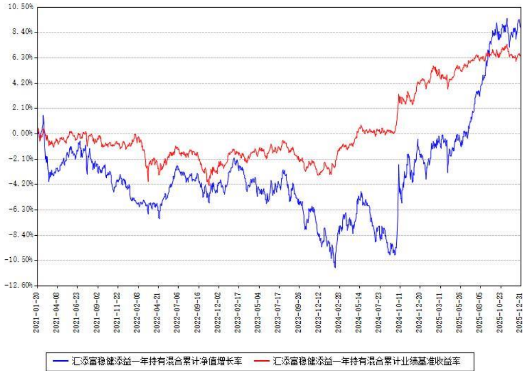
汇添富稳健添益一年持有混合累计净值增长率与同期业绩基准收益率对比图

注：本基金建仓期为本《基金合同》生效之日（2021年01月20日）起6个月，建仓期结束时各项资产配置比例符合合同约定。