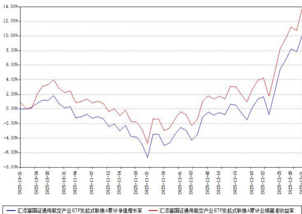
汇添富国证通用航空产业ETF发起式联接A累计净值增长率与同期业绩基准收益率对比图