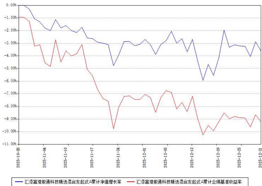
汇添富港股通科技精选混合发起式A累计净值增长率与同期业绩基准收益率对比图