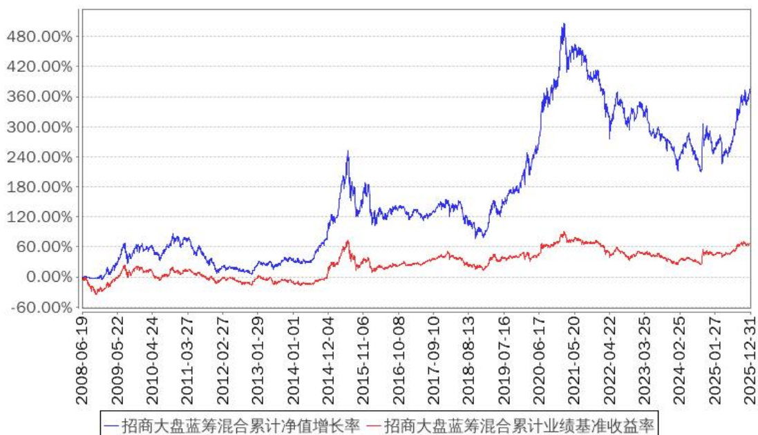
招商大盘蓝筹混合累计净值增长率与同期业绩比较基准收益率的历史走势对比图