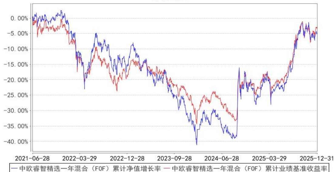
中欧睿智精选一年混合（FOF）累计净值增长率与同期业绩比较基准收益率的历史走势对比图

注：2023 年 5 月 5 日起组合业绩比较基准变更为中证偏股型基金指数收益率×80%+银行活期存款利率(税后)×20%。