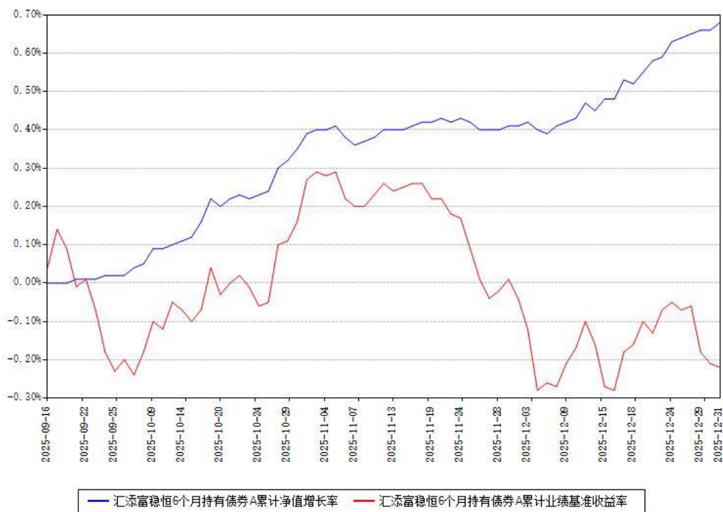
汇添富稳恒6个月持有债券A累计净值增长率与同期业绩基准收益率对比图