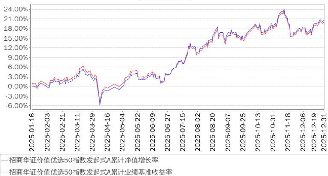
招商华证价值优选50指数发起式A累计净值增长率与同期业绩比较基准收益率的历史走势对比图