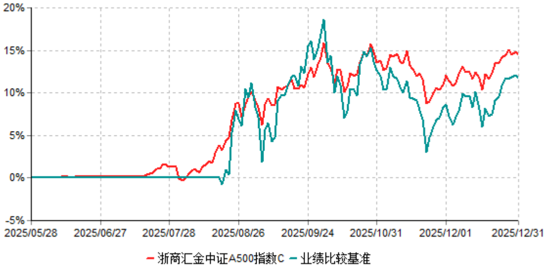
浙商汇金中证A500指数C累计净值增长率与业绩比较基准收益率历史走势对比图 (2025年05月28日-2025年12月31日)

注：本基金的基金合同生效日为2025年05月28日，自基金合同生效日起至本报告期末不满一年。至本报告期末，本基金已完成建仓，但报告期末距建仓结束不满一年，建仓期为2025年5月28日-2025年11月27日，本基金建仓期结束时各项资产配置比例符合合同的约定。