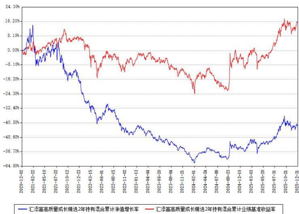
汇添富高质量成长精选2年持有混合累计净值增长率与同期业绩基准收益率对比图

注：本基金建仓期为本《基金合同》生效之日（2020年12月02日）起6个月，建仓期结束时各项资产配置比例符合合同约定。