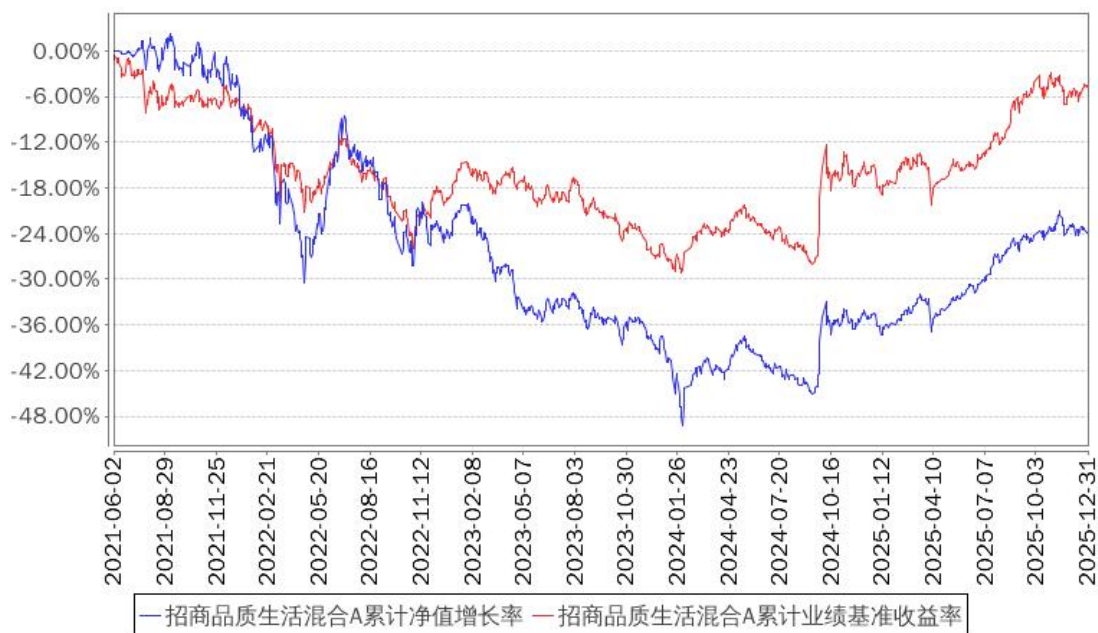
招商品质生活混合A累计净值增长率与同期业绩比较基准收益率的历史走势对比图