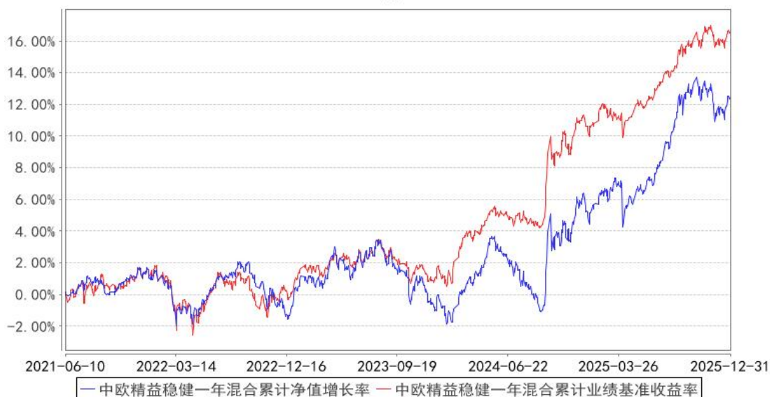
中欧精益稳健一年混合累计净值增长率与同期业绩比较基准收益率的历史走势对比图