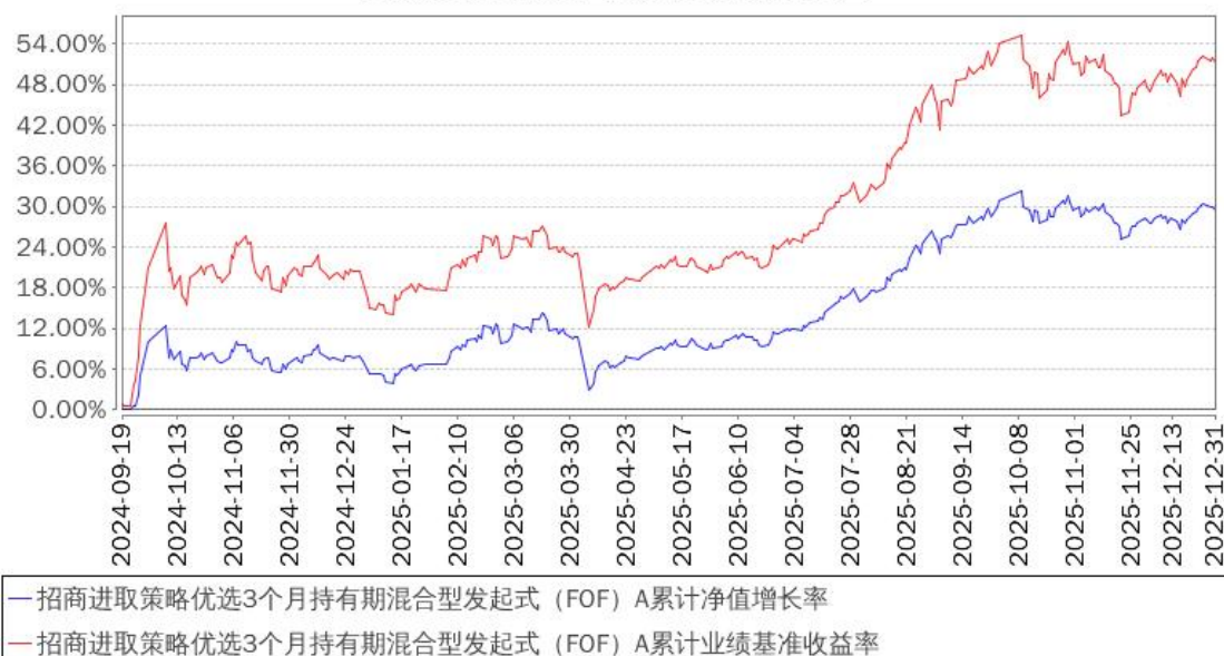
招商进取策略优选3个月持有期混合型发起式（FOF）A累计净值增长率与同期业绩比较基准收益率的历史走势对比图