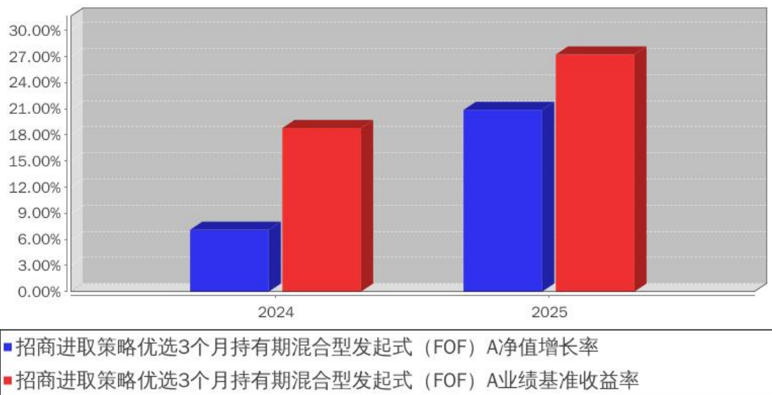
招商进取策略优选3个月持有期混合型发起式（FOF）A基金每年净值增长率与同期业绩比较基准收益率的对比图