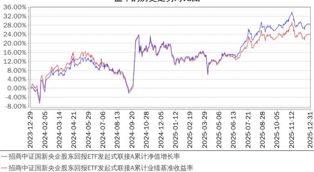
招商中证国新央企股东回报ETF发起式联接A累计净值增长率与同期业绩比较基准收益率的历史走势对比图