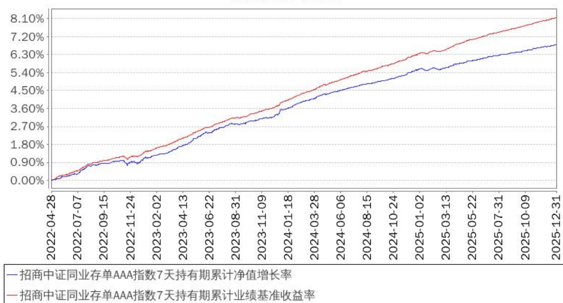
招商中证同业存单AAA指数7天持有期累计净值增长率与同期业绩比较基准收益率的历史走势对比图