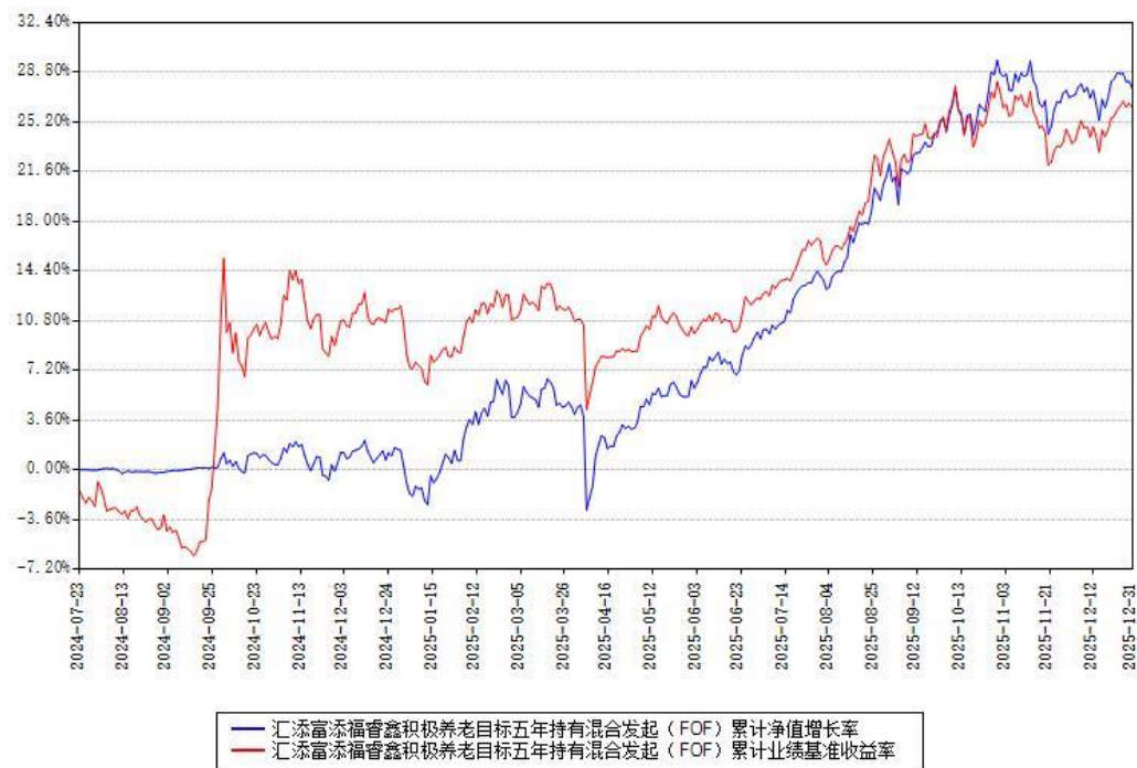
汇添富添福睿鑫积极养老目标五年持有混合发起（FOF）累计净值增长率与同期业绩基准收益率对比图

注：本基金建仓期为本《基金合同》生效之日（2024 年 07 月 23 日）起 6 个月，建仓期结束时各项资产配置比例符合合同约定。