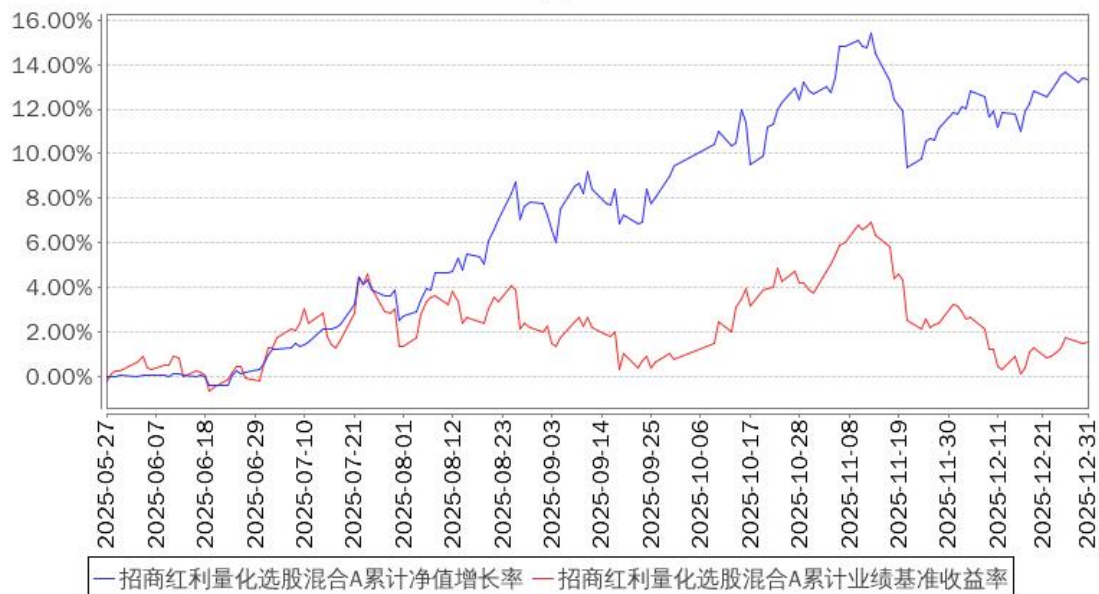
招商红利量化选股混合A累计净值增长率与同期业绩比较基准收益率的历史走势对比图