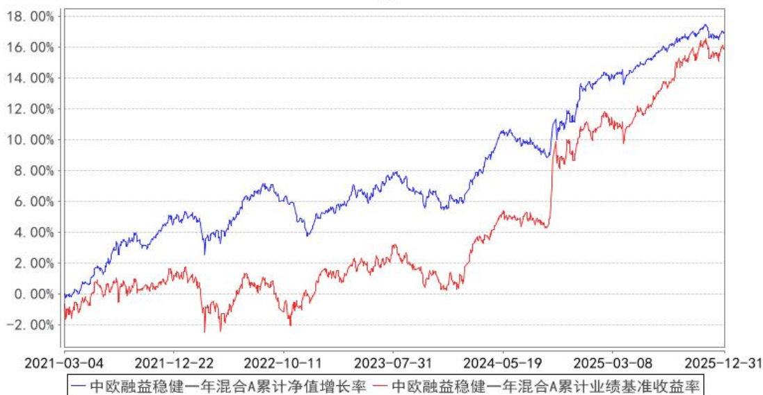
中欧融益稳健一年混合A累计净值增长率与同期业绩比较基准收益率的历史走势对比图