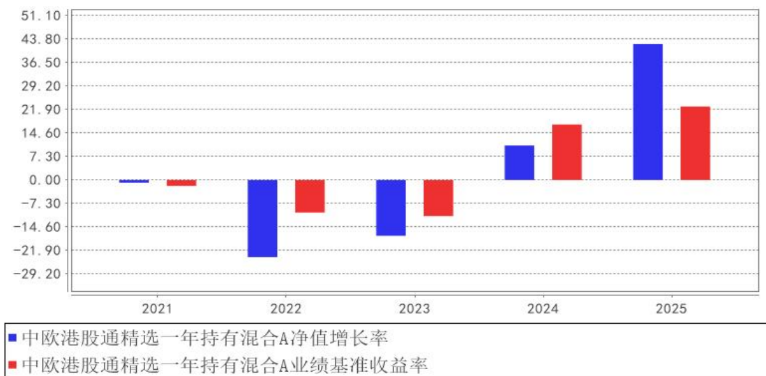
中欧港股通精选一年持有混合A基金每年净值增长率与同期业绩比较基准收益率的对比图

注：本基金合同生效日为 2021 年 12 月 8 日，2021 年度数据为 2021 年 12 月 8 日至 2021 年 12 月 31 日数据。