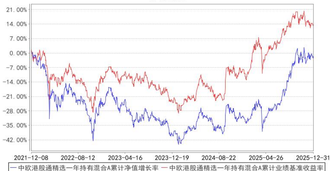
中欧港股通精选一年持有混合A累计净值增长率与同期业绩比较基准收益率的历史走势对比图