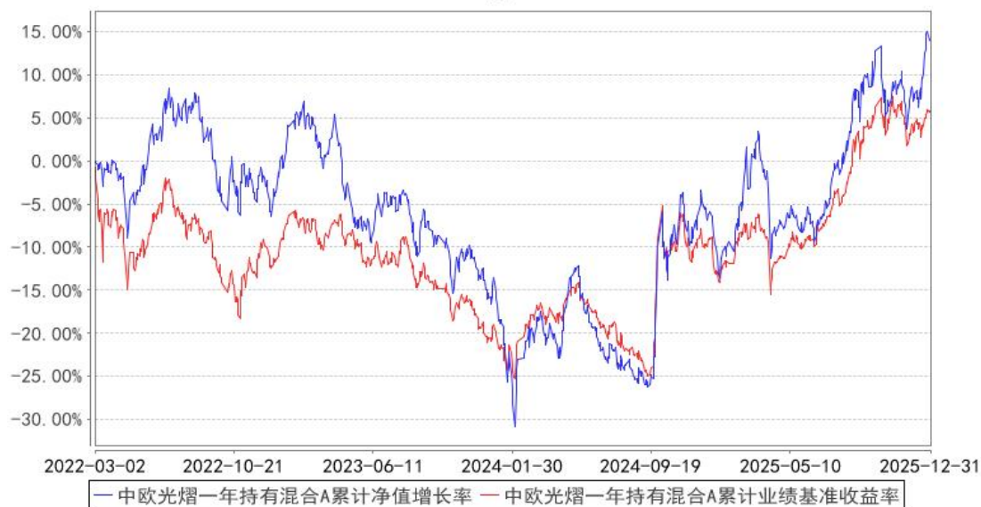
中欧光熠一年持有混合A累计净值增长率与同期业绩比较基准收益率的历史走势对比图