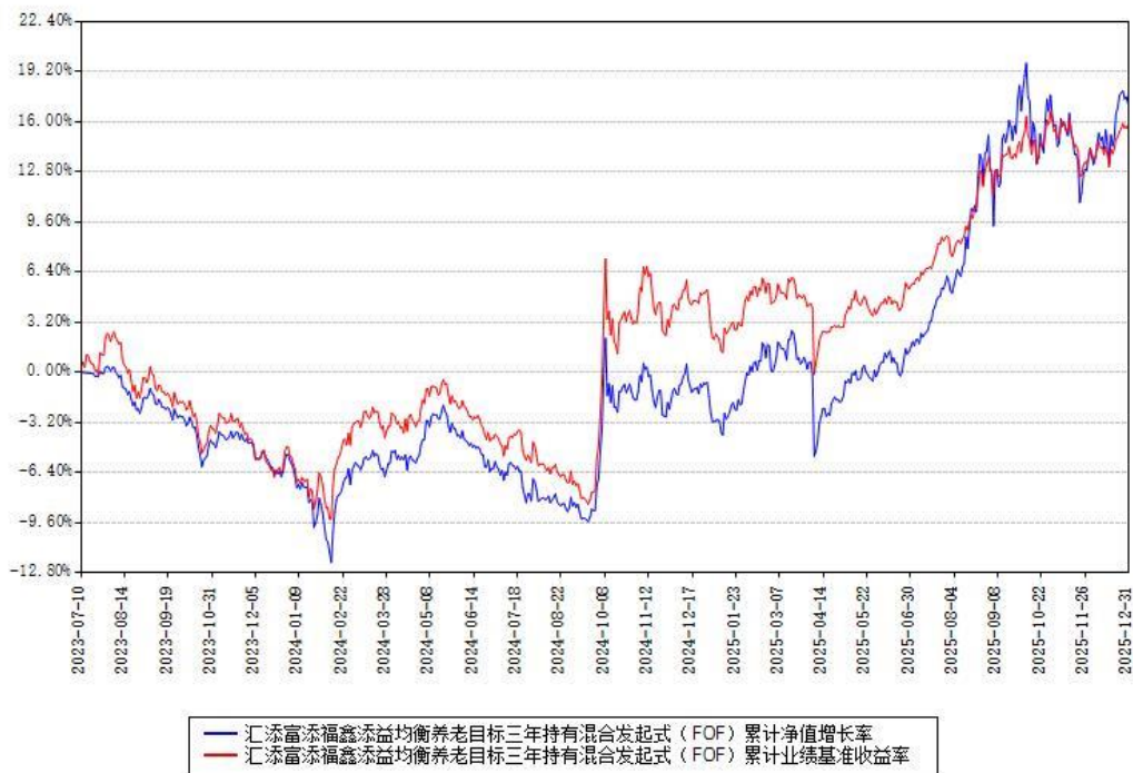
汇添富添福鑫添益均衡养老目标三年持有混合发起式（FOF）累计净值增长率与同期业绩比较基准收益率对比图

注：本基金建仓期为本《基金合同》生效之日（2023 年 07 月 10 日）起 6 个月，建仓期结束时各项资产配置比例符合合同约定。