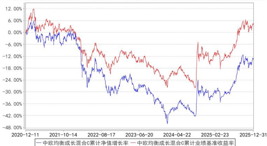
中欧均衡成长混合C累计净值增长率与同期业绩比较基准收益率的历史走势对比图

注：2024 年 8 月 13 日起组合业绩比较基准变更为沪深 300 指数收益率*90%+中证港股通综合指数(人民币)收益率*5%+银行活期存款利率(税后)*5%。