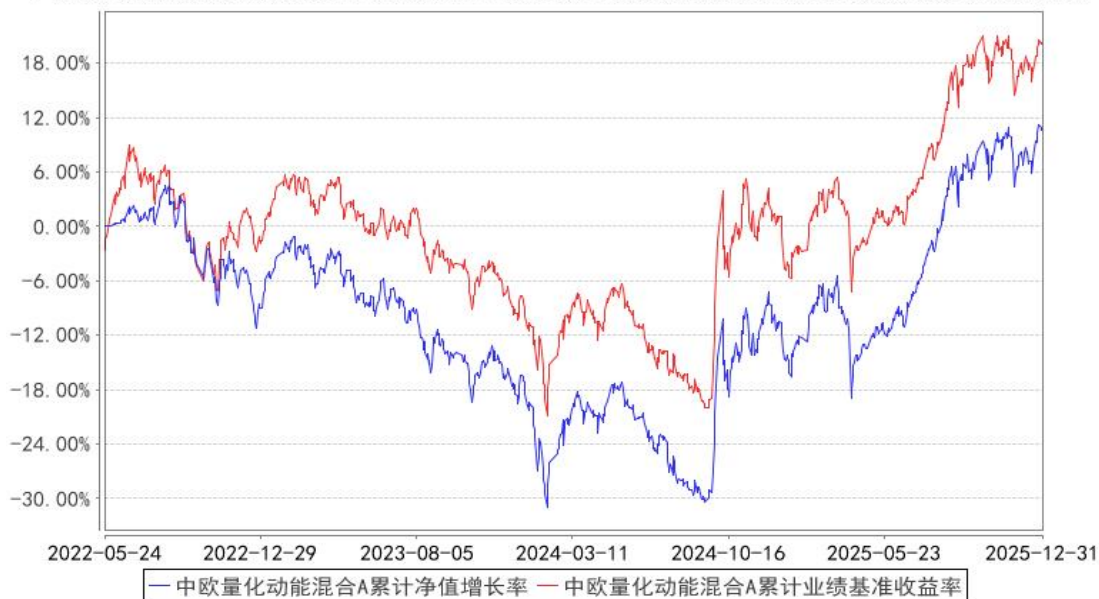
中欧量化动能混合A累计净值增长率与同期业绩比较基准收益率的历史走势对比图