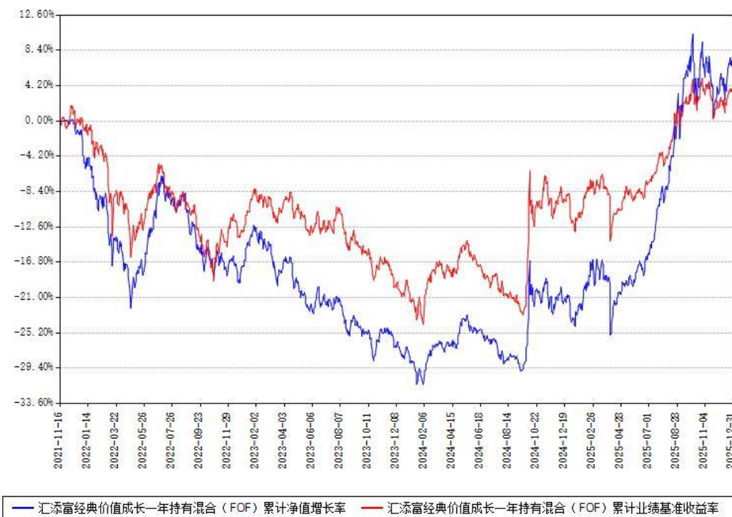
汇添富经典价值成长一年持有混合（FOF）累计净值增长率与同期业绩比较基准收益率对比图

注：本基金建仓期为本《基金合同》生效之日（2021年11月16日）起6个月，建仓期结束时各项资产配置比例符合合同约定。