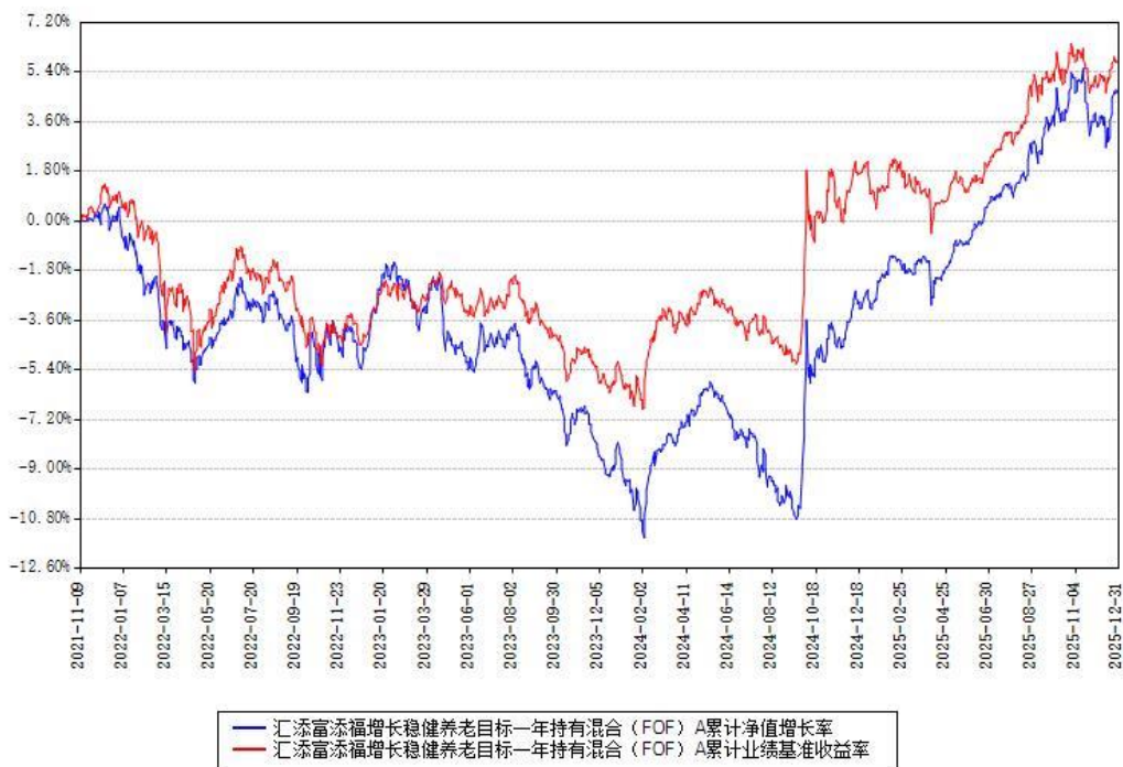
汇添富添福增长稳健养老目标一年持有混合（FOF）Y累计净值增长率与同期业绩基准收益率对比图