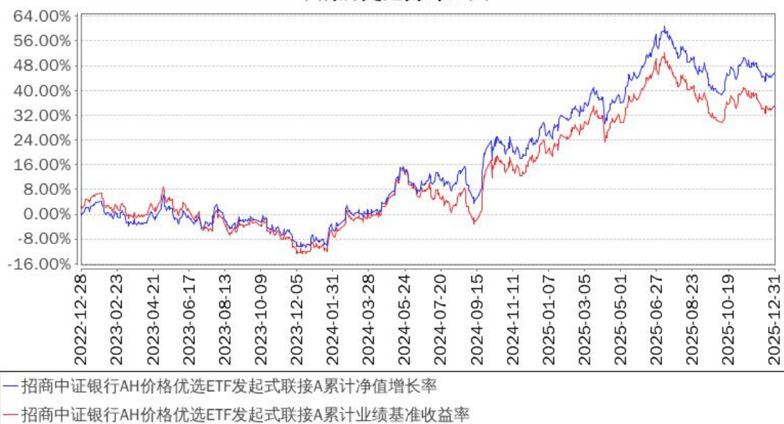
招商中证银行AH价格优选ETF发起式联接A累计净值增长率与同期业绩比较基准收益率的历史走势对比图