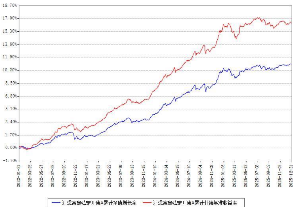
汇添富鑫弘定开债A累计净值增长率与同期业绩基准收益率对比图

注：本基金建仓期为本《基金合同》生效之日（2022年01月21日）起6个月，建仓期结束时各项资产配置比例符合合同约定。