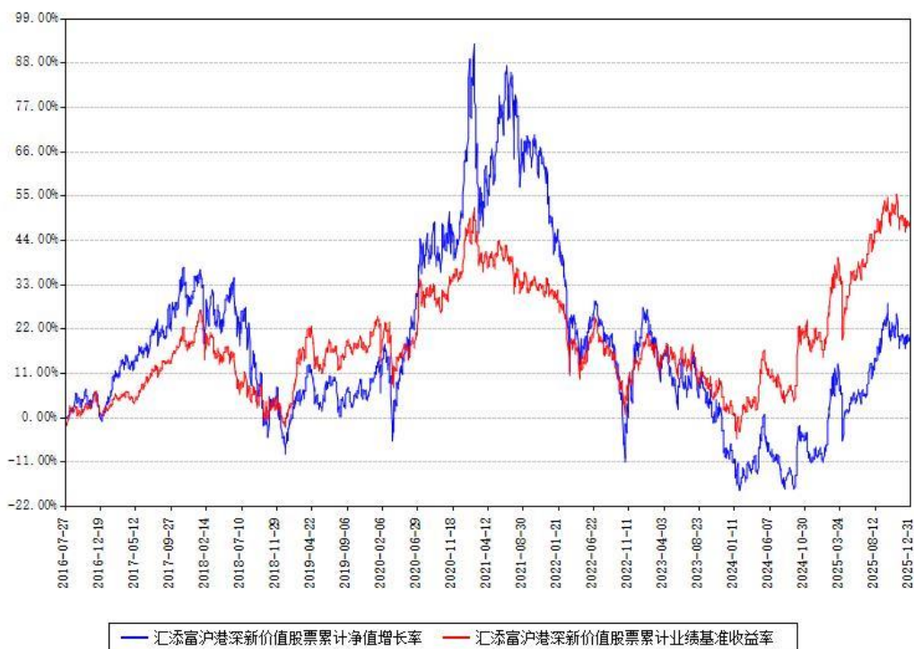
汇添富沪港深新价值股票累计净值增长率与同期业绩基准收益率对比图

注：本基金建仓期为本《基金合同》生效之日（2016年07月27日）起6个月，建仓期结束时各项资产配置比例符合合同约定。