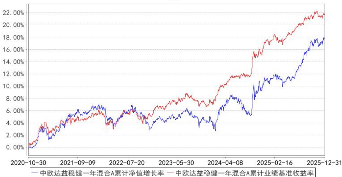
中欧达益稳健一年混合A累计净值增长率与同期业绩比较基准收益率的历史走势对比图