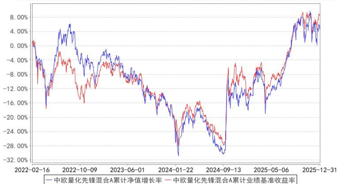
中欧量化先锋混合A累计净值增长率与同期业绩比较基准收益率的历史走势对比图