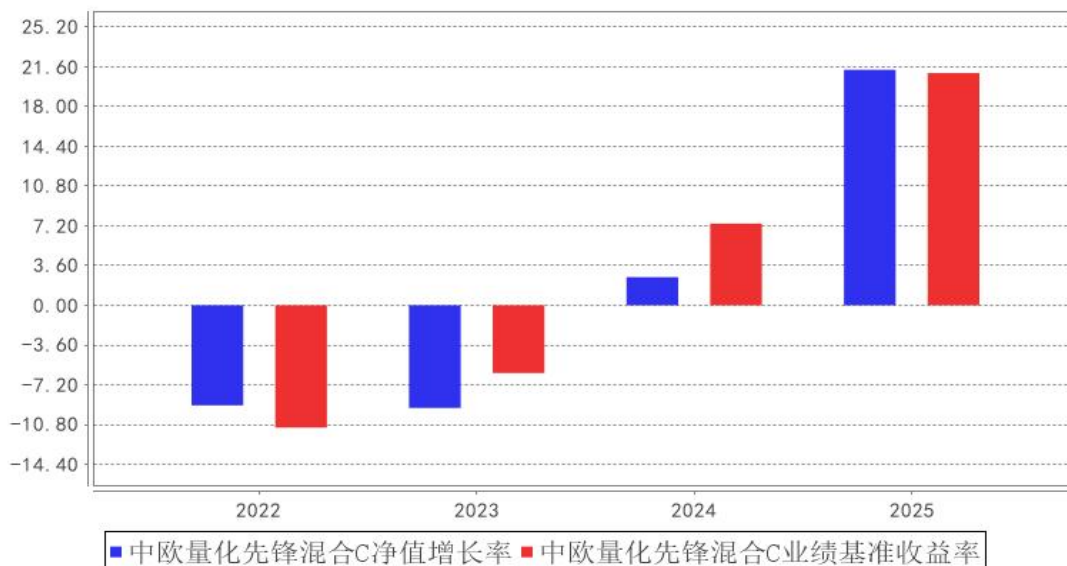
中欧量化先锋混合C基金每年净值增长率与同期业绩比较基准收益率的对比图

注：本基金合同生效日为 2022 年 2 月 16 日，2022 年度数据为 2022 年 2 月 16 日至 2022 年 12 月 31 日数据。