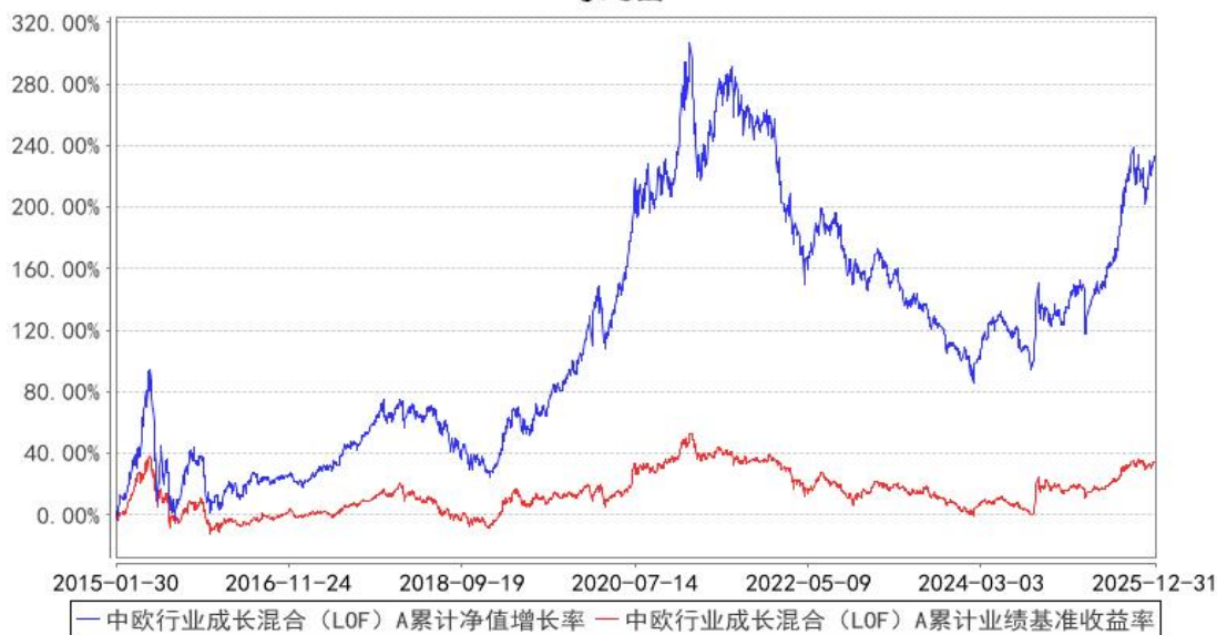
中欧行业成长混合 (LOF) A 累计净值增长率与同期业绩比较基准收益率的历史走势对比图