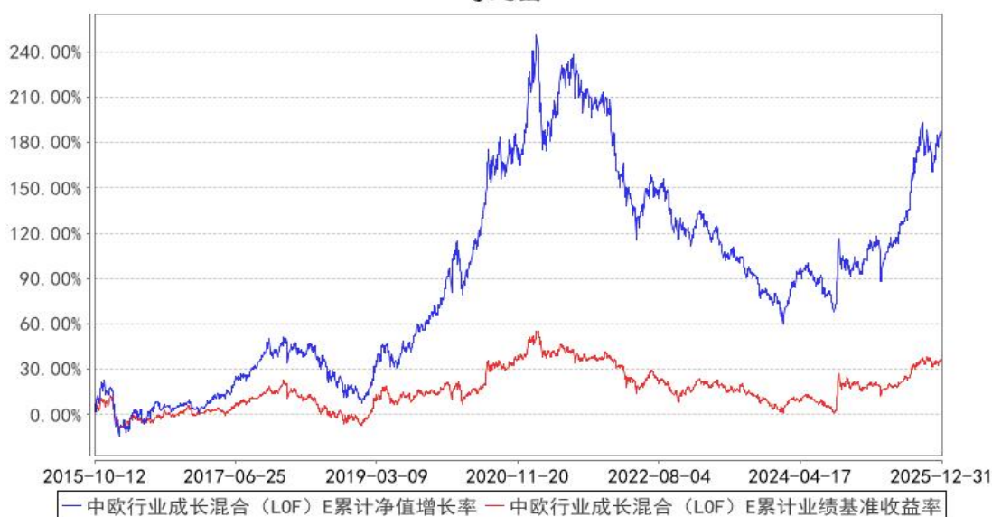
中欧行业成长混合 (LOF) E 累计净值增长率与同期业绩比较基准收益率的历史走势对比图

注：本基金自 2015 年 10 月 8 日新增 E 类份额，图示日期为 2015 年 10 月 12 日至 2025 年 12 月 31 日。