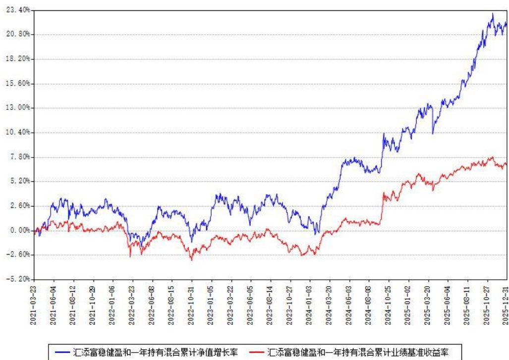
汇添富稳健盈和一年持有混合累计净值增长率与同期业绩比较基准收益率对比图

注：本基金建仓期为本《基金合同》生效之日（2021年03月23日）起6个月，建仓期结束时各项资产配置比例符合合同约定。