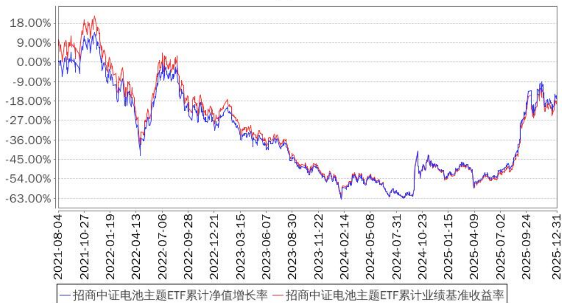
招商中证电池主题ETF累计净值增长率与同期业绩比较基准收益率的历史走势对比图